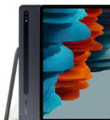
GALAXY Tab S7 LTE T870

Ekran: 11" Memorija: 128GB,6GB Zadnja kamera: 13MP Prednja kamera: 8MP Baterija: 7040mAh Garancija: 2 godine