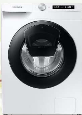
WW70T552DAW1S7 Veš mašina

Kapacitet 7kg, 1200 o/min, A+++, Eco Bubble, Add Wash, Digitalni inverter motor, dimenzije 60x85x55 cm, 2+3 godine garancije