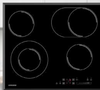
CTR164NC01/BOL Ugradbena ploča

Keramička ploča za kuhanje s izbornikom osjetljivim na dodir, 7 kW, koso rezani okvir, dimenzije 575x505x52.6 mm, 2+3 godine garancije