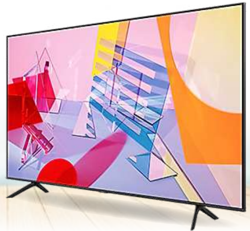
SMART UHD/4K QLED TV 65Q80TAT

SMART• QLED 4K• Qantum Dot tehnologija• 4K All Upscaling tehnologija• Quantum 4K procesor• Quantum HDR• Real Game+ funkcionalnost• AVA tehnologija Stopostotni volumen boja • Multi view način rada• Vrhunsko UHD zatamljenje• Mega Contrast• Dolby Digital Plus• Operativni sistem Tizen• HDMI x3• USB x2• Garancija: 2 godine