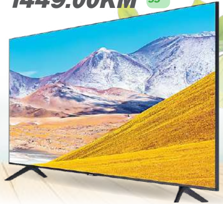
CRYSTAL UHD/4K SMART LED TV TU8072

SMART• UHD/4K• Crystal Display zaslon• Crystal 4K procesor• HDR (High Dynamic Range)• HDR 10+• PurColor tehnologija• UHD zatamljenje• Dolby Digital Plus• Operativni sistem Tizen • HDMI x 2• USB x 1• Garancija: 2 godine