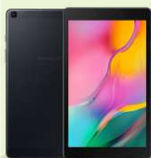
GALAXY Tab A8.0 T290

Ekran: 8" Memorija: 32GB,2GB Zadnja kamera: 8MP Prednja kamera: 2MP Baterija: 5100mAh Garancija: 2 godine