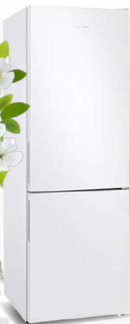
RB3VRS100WW/EO Kombinovani frižider

Kombinovani frižider, No frost, zapremina frižidera 228l, zapremina zamrzivača 89l, A+, 59.5x185x65cm, 2+3 godine garancije