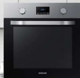
NV70K1340BS/O Ugradbena pećnica

Električna pećnica s dvostrukim ventilatorom, zapremina rerne 68l, katalitički sistem čišćenja, dimenzije 595x595x566mm, 2+3 godine garancije