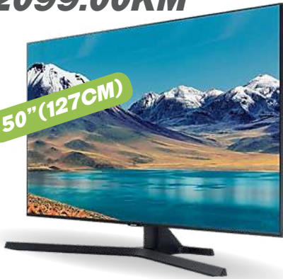
DYNAMIC CRYSTAL UHD/4K SMART LED TV 50TU8502

SMART• UHD/4K• Dynamic Crystal Display zaslon• Crystal 4K procesor• UHD Engine• HDR (High Dynamic Range)• Mega contrast• HDR 10+• UHD zatamljenje• Dolby Digital Plus• Operativni sistem Tizen • HDMI x 2• USB x 1• Garancija: 2 godine