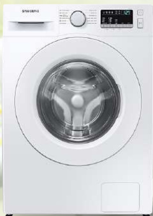
WW70T4040EE1LE Veš mašina

Kapacitet 7kg, 1400 o/min, A+++, higijenska para eliminiše 99.9% bakterija, Digitalni inverter motor, dimenzije 60x85x55cm, 2+3 godine garancije