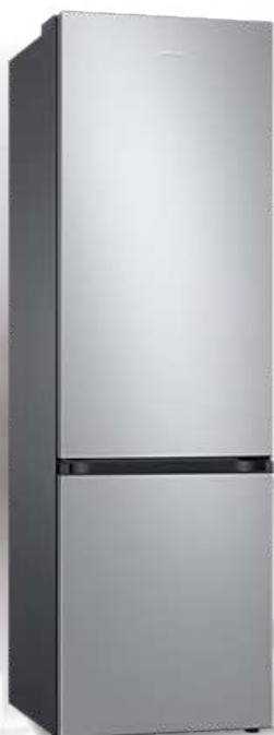
RB38T600FSA/EK Kombinovani frižider

Kombinovani frižider, No frost, zapremina frižidera 273l, zapremina zamrzivača 112l, A+, 59.5x203x65, 2+3 godine garancije