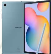
GALAXY Tab S6 LTE P615

Ekran: 10.4" Memorija: 64GB,4GB Zadnja kamera: 8MP Prednja kamera: 5MP Baterija: 7040mAh Garancija: 2 godine