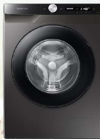
WW80T534DAX/S7 Veš mašina

Kapacitet 8kg, 1400 o/min, Eco Bubble, AI Control, Auto Dispense tehnologija, higijenska para eliminiše 99.9% bakterija, Digitalni inverter motor, dimenzije 60x85x55cm, 2+3 godine garancije