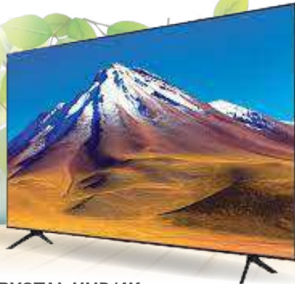
CRYSTAL UHD/4K SMART LED TV TU7092

SMART• UHD/4K• Crystal Display zaslon• Crystal 4K procesor• HDR (High Dynamic Range)• HDR 10+• PurColor tehnologija• UHD zatamljenje• Dolby Digital Plus• Operativni sistem Tizen • HDMI x 2• USB x 1• Garancija: 2 godine